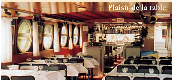
Plaisir de la table